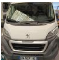
Lot n° 131