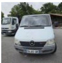
Lot n° 130