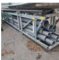
Lot n° 134