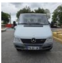
Lot n° 129